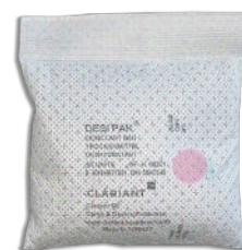
Pink Spot Dessicant Bag active r.H. > 40% relative