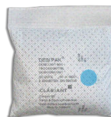
Blue Spot Dessicant Bag active r.H. < 40% relative

Ce sachet 1/100 ème UD absorbe 1 gr d'eau à 40% d'humidité relative