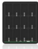
Station de charge sans fil du Tag T-10R