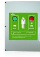
Boitier Antenna Verification