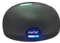
Interface de communication Log Tag (non inclus)