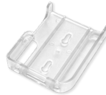
Support mural (non inclus)