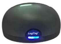
Interface de communication Log Tag (non inclus)