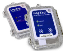
Boîtier de protection (non inclus)