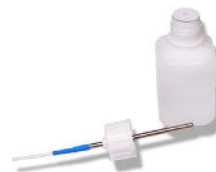
Glycol (non inclus)