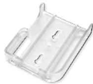
Support mural (non inclus)